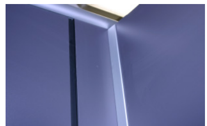
Innenansicht Zwischenwandanschluss Kopfschiene und Türanschlag