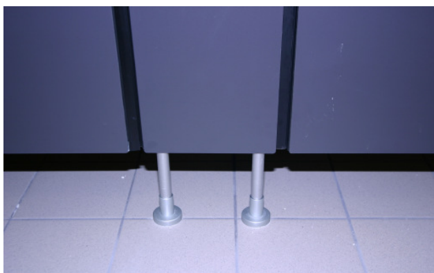
Aussenansicht Füsse, Türanschlagprofil und Unfallschutzradius von 5mm